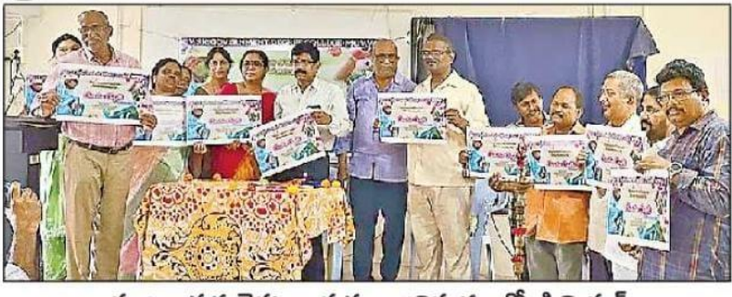
స్పజనాత్మక నైపుణ్య ప్రతుల ఆవిష్మరణలో కె.ఎ.వి.ఎస్.వి.(పసాద్-శ్రాస్త్రి, అధ్యాపకులు

కూచిపూడి, న్యూస్ టుడే: మొవఁ వీఎస్ఆర్ ప్రభుత్వ డిగ్రీ, పీజీ కళా కళాశాల వ్యవస్థాపక అభి స్పజ అనే అంశంపై విద్యార్థు లకు ఈ నెల ఆరో తేదీ