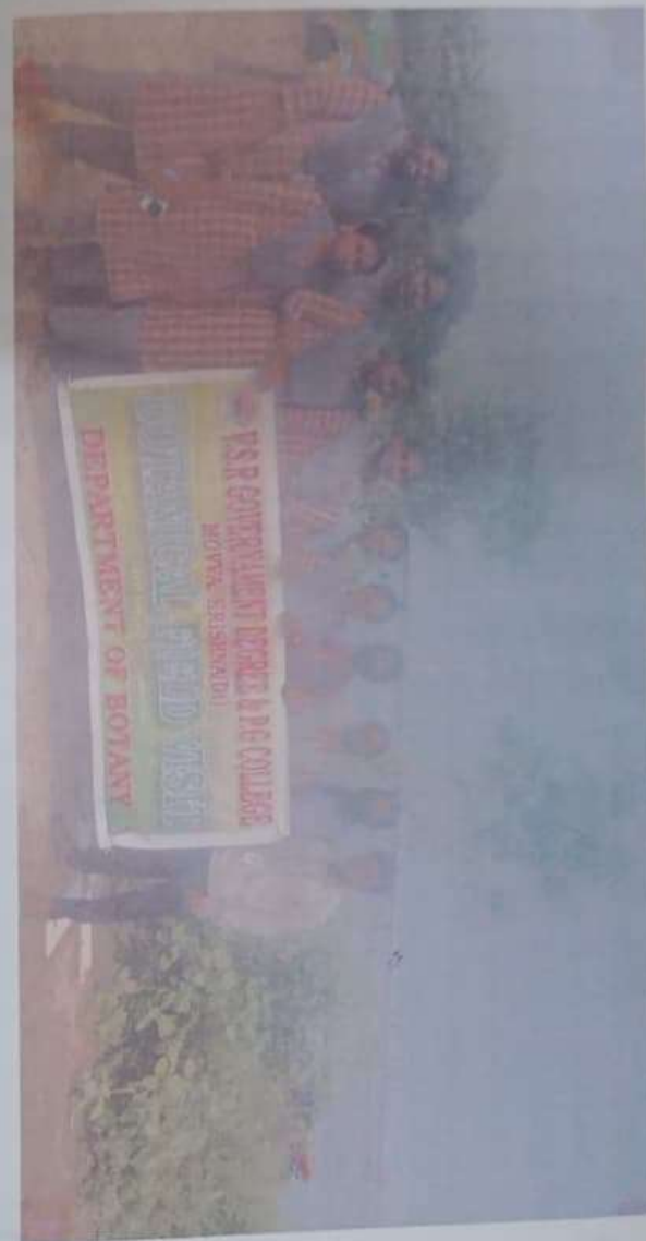
B.Sc B.Z.C Final Year Students Field Visit Penumudi on 09/11/2023